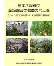
▲省エネで収益力向上を

省エネ機器の導入に加え、被覆の多層化や循環扇の導入、環境制御装置の導入など様々な手段を用いて燃料使用量50%以上削減に取り組みましょう！