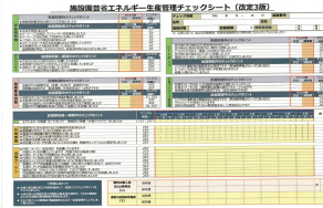
▲省エネチェックシート