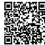
▲省エネ通知のページQRコード