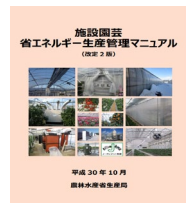
▲省エネマニュアル