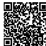
▲省エネ通知のページQRコード