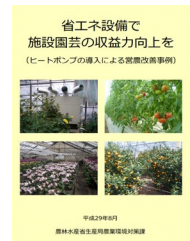
▲省エネで収益力向上を