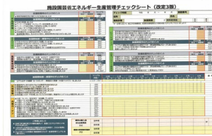
▲省エネチェックシート